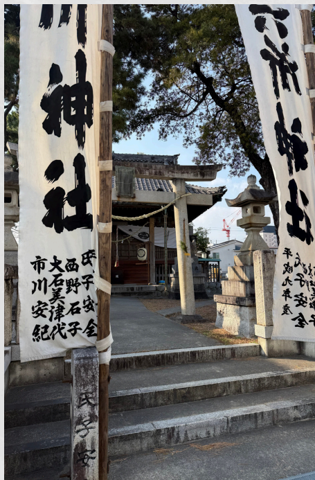
自由参加で事業所近くの六所神社に 計8名で初詣に行きました！

謹んで新年のご挨拶を申し上げます。 日頃より多方面から多大なるご支援を いただき、心より御礼申し上げます。 昨年9月の開所以来、本紙も第3号を 迎えることができました。継続してお 読みいただいている皆様、そして初め て手に取ってくださった皆様、誠に ありがとうございます。 本年も利用者様の想いに寄り添い、支 援員一同、より一層心地の良い支援が できるよう努めてまいります。皆様に とって実り多き一年となりますようお 祈り申し上げます。本年もどうぞよろ しくお願いいたします。