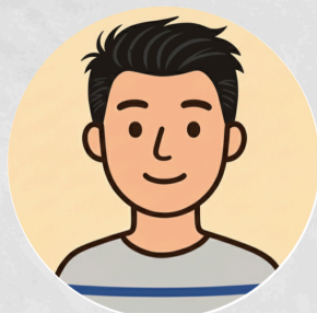
利用者Nさん ご利用4ヶ月目

レクリエーション♪ 昨年の最終通所日はレクリエーショ ンを行いました！ トランプやGO、人生ゲームなどを 支援員含めみんなで楽しみました♪ 訓練とは一味違うレクリエーションなら ではの雰囲気から、普段は消極的な利用 者さんも積極的な関わりをとられ、コミ ュニケーションを取ることへの障壁が下 がることに繋がりました。今後はコミュ ニケーション向上のためのレクリエーシ ョンを、月一回程度で開催予定です！