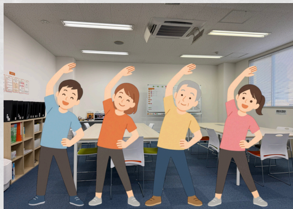
事業所内での体操イメージ図

リライトではお昼休憩後の講座の前に、三分から六分のストレッチや体操を行っています♪健康維持や集中力、筋力、体力向上などを主な目的として行っております。みんなですクリーンを見ながら体を動かすことで休憩モードからの切り替えにも繋がっています！